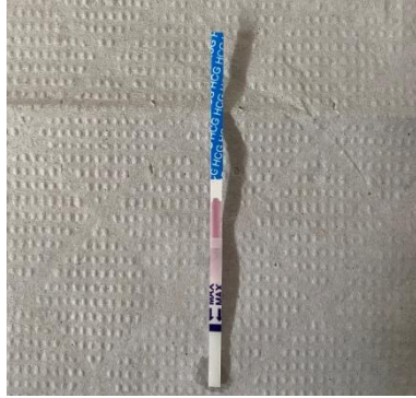
Figura 3. Tira teste pós-submergida

08. Remover a tira teste do contato com a amostra e colocá-la sob uma superfície limpa, plana e seca (Figura 3);