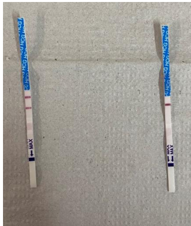
Figura 4. Tiras prontas para interpretação do resultado

09. Aguardar o aparecimento da(s) linha(s) colorida(s). Interpretar o resultado em 5 minutos, não devendo realizar a leitura depois de transcorrido esse tempo (Figura 4);