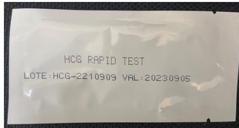
Figura 1. Teste rápido de detecção de hCG

03. Após a obtenção do material a ser testado (urina), proceder com a separação do teste, verificando as condições e data de validade antes de utilizar o mesmo (Figura 1);