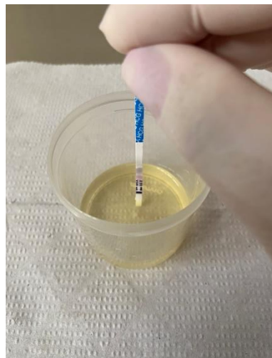
Figura 2. Submersão do teste na amostra coletada

03. Amostras coletas em qualquer hora do dia podem ser utilizadas para realização do teste, contudo, a primeira urina da manhã é recomendada por conter maiores concentrações de hormônio hCG;